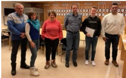
Fra samarbeidsmøtet med kommunen i 2021.

I prosessen med kommuneplanens arealplan har vi spilt inn at idrettsrådet ønsker å bli involvert i det videre arbeidet for å ivareta idrettens interesser og fremtidige arealbehov, men vi er foreløpig ikke involvert. Kommunen er forsinket med igangsetting av arbeidet med ny kommunedelplan for fysisk aktivitet, idrett mv. Vi har pr nå ikke info om når arbeidet igangsettes.